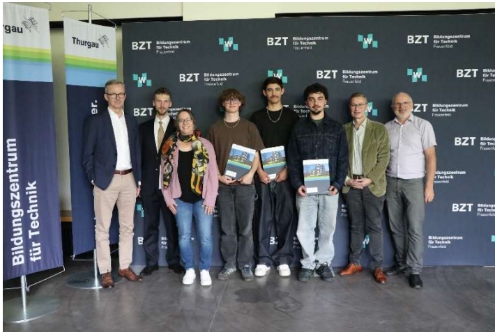
Die drei Preisträger

Folgende Gewinnerinnen und Gewinner wurden am 08. Mai 2025 an der Prämierung der Vertiefungsarbeiten von uns ausgezeichnet.